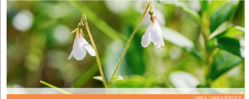
LINNEA, LINNAEA BOREALIS

🇸🇪 Kalmar County consists of the Eastern parts of Småland and Öland provinces. It was created by provincial divisions in 1634, but it was not until the 1700's that it received its present borders. The county has 12 municipalities which Kalmar is the county town. It has a varied landscape of deep forests, lakes, archipelagos, Bronze Age landscapes and the unique Alvar on Öland. A part of Kalmar is located in Glasriket.