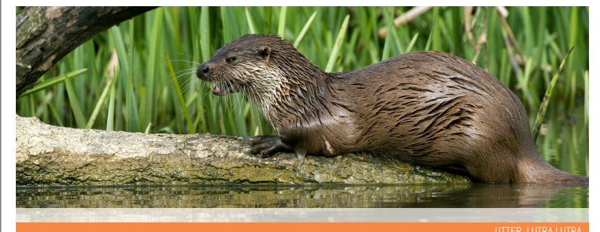
UTTER, LUTRA LUTRA

🇸🇪 Linnea is Smålands county flower and was also Carl Linnaeus' favorite flower. He was often depicted with a Linnea in hand and it was also part of his noble weapon. Linnea is a subshrub forming meter-long stems. It has small, round leaves that are in pairs. In Småland, it blooms in June-July. The flower stalks have a two-piece top with a hanging flower on each branch. The flowers are fragrant and most intense during the evenings. The corolla is bell-shaped with an vitro-free exterior and yellow or red patterned interior. The fruits have sticky hair that can easily stick to animals and clothes which means they can spread over long distances. Linnea is common in almost all of Sweden, except in the southernmost parts. It thrives in mossy spruce areas near lying trunks or stumps, but it also grows on top of mountains. In the past, they used Linnea to treat gout and joint pains.